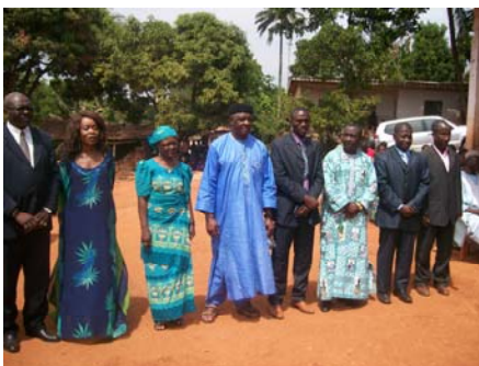
L'équipe de l'Asbaf

Ecole publique de Machoutvi à Manki II - Ecole publique de Fontain II à Foumban - Ecole publique de Foyet à Njimom