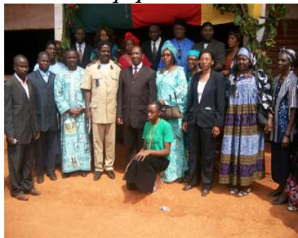
Les autorités locales et l'équipe Asbaf