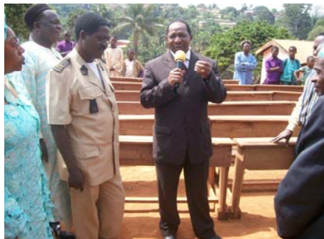
Réception des bancs par le Préfet